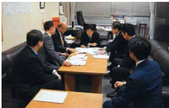
石川道路局長要望

ご同行いただき、力強い後押しをいただきました。 今後も事業化されるよう、引き続き要望を続けてまいります。