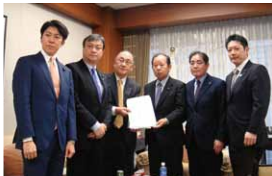
二階自民党幹事長要望

ご同行いただき、力強い後押しをいただきました。 今後も事業化されるよう、引き続き要望を続けてまいります。